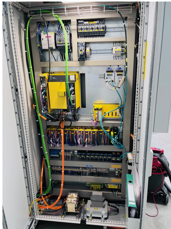
Tschudin TBF 440 – Bild 1 von 3