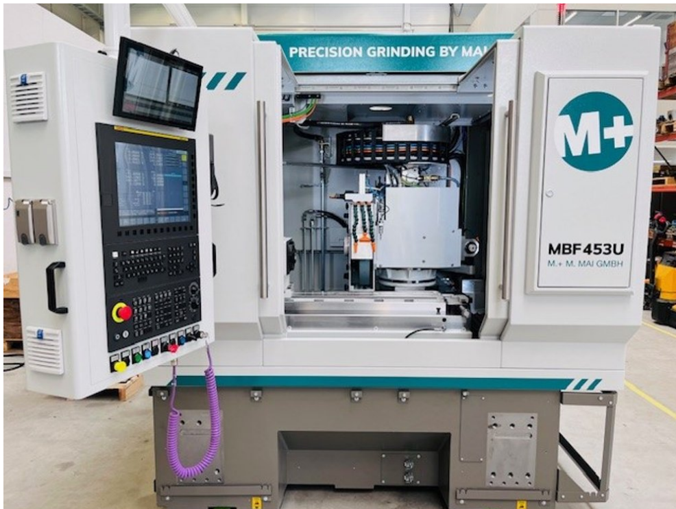
Tschudin MBF 453U – Bild 1 von 5