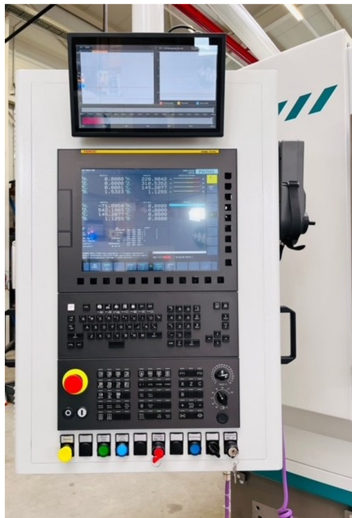
Tschudin MBF 453U – Bild 5 von 5