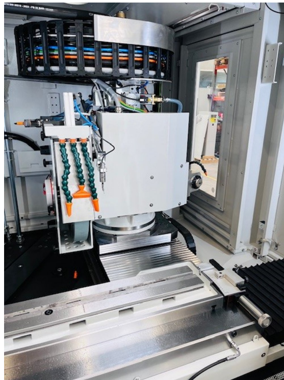
Tschudin MBF 453U – Bild 3 von 5