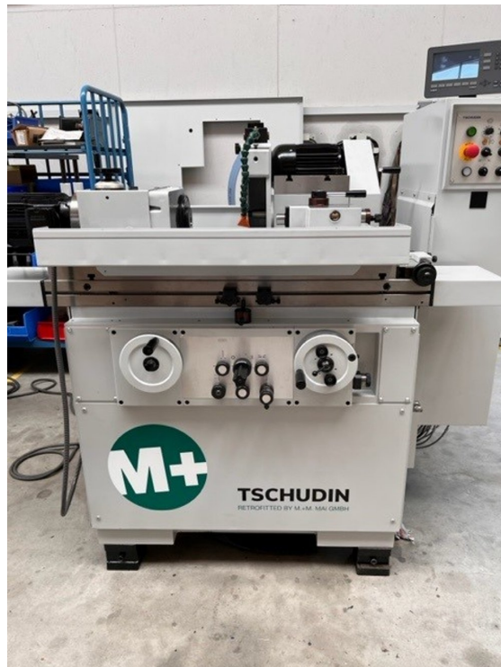
Tschudin HTG 310 – Bild 1 von 4