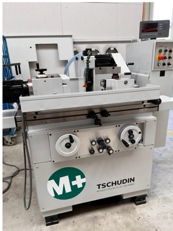
Tschudin HTG 310 – Bild 2 von 4