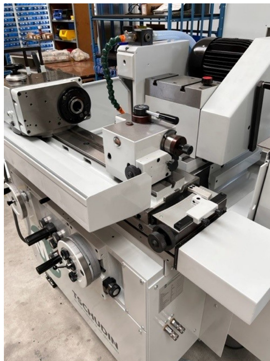
Tschudin HTG 310 – Bild 4 von 4