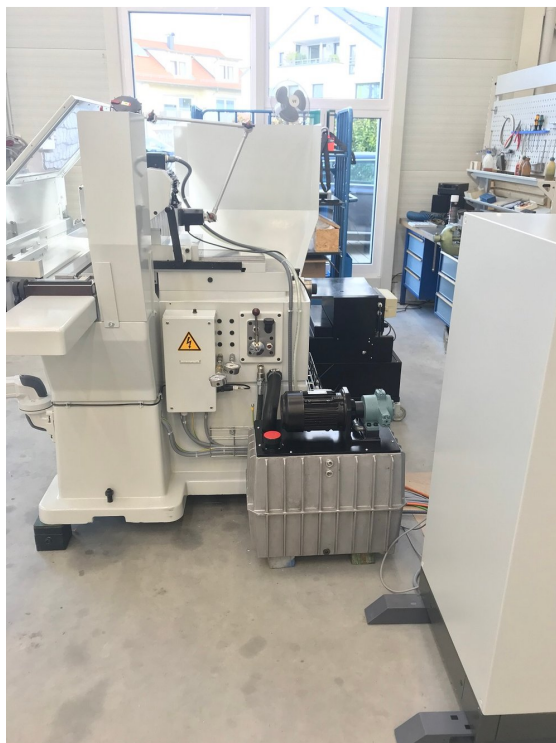
Tschudin HTG 610 I – Bild 4 von 4