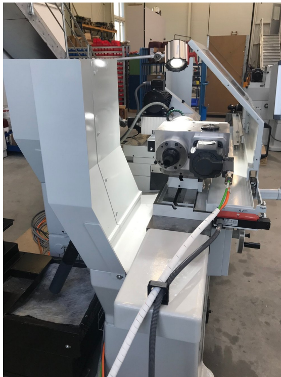
Tschudin HTG 610 I – Bild 3 von 4