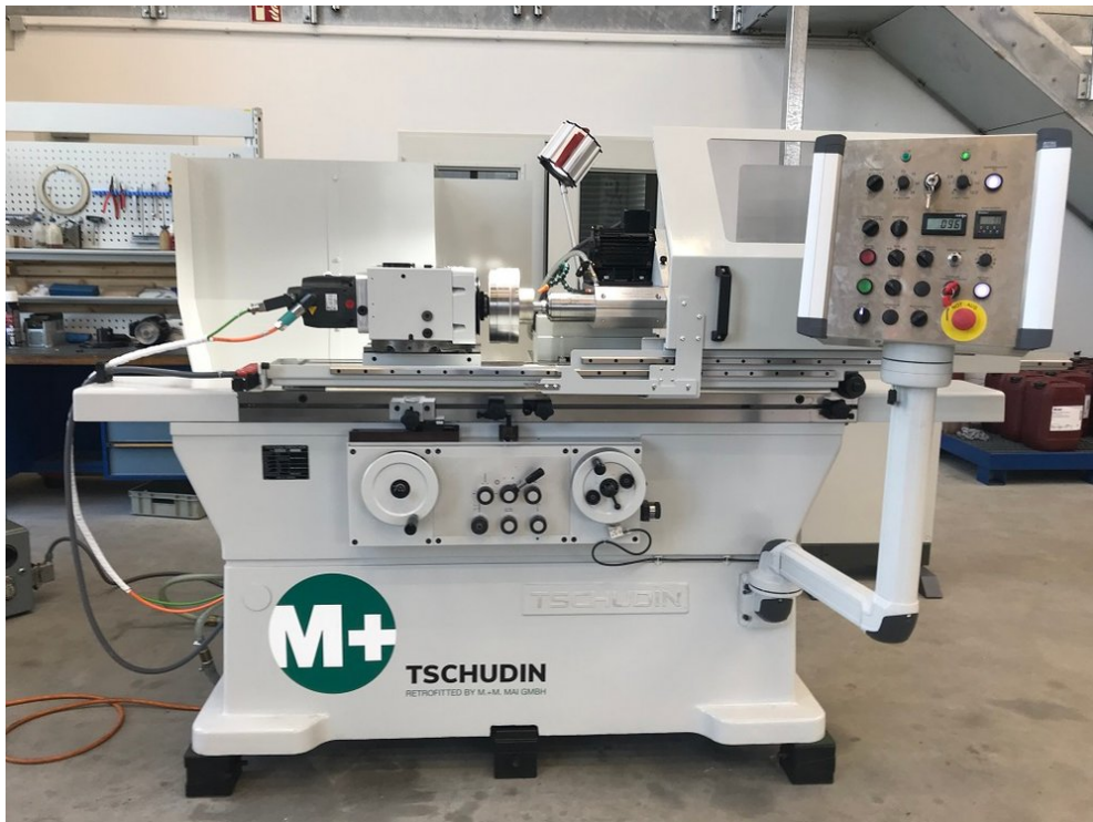
Tschudin HTG 610 I – Bild 1 von 4