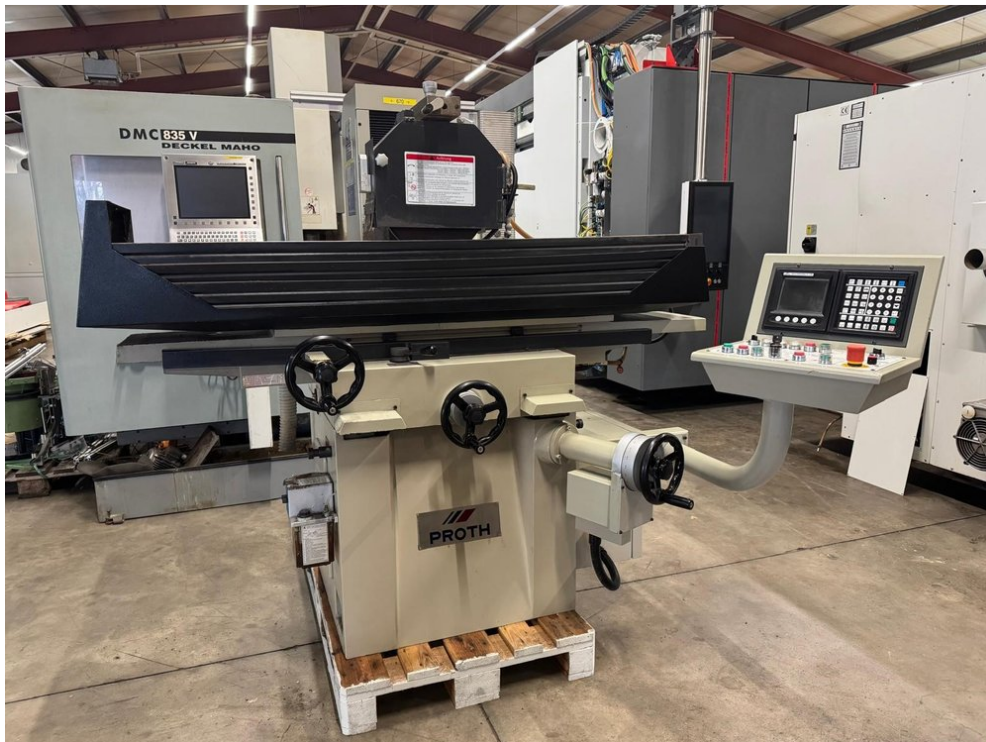
Proth PSGS-3060 – Bild 1 von 6