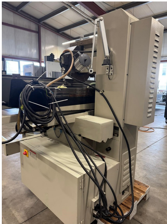
Proth PSGS-3060 – Bild 3 von 6