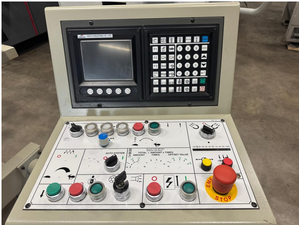
Proth PSGS-3060 – Bild 5 von 6