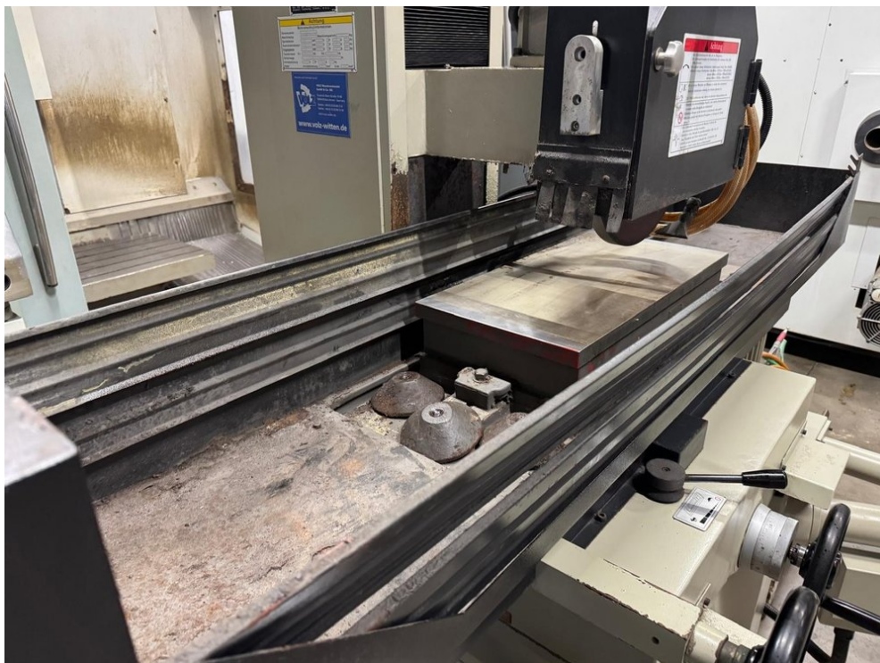
Proth PSGS-3060 – Bild 4 von 6