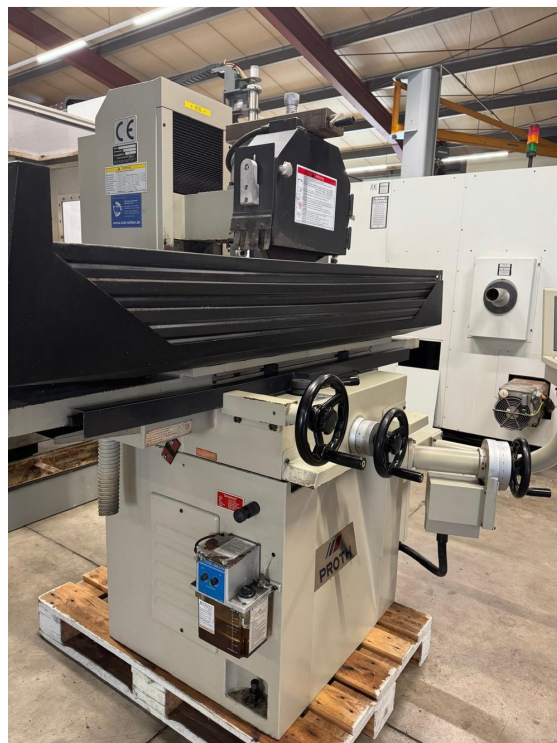
Proth PSGS-3060 – Bild 2 von 6