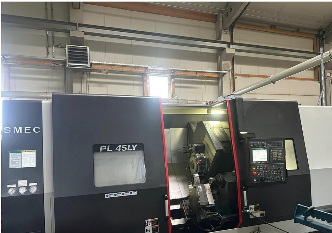
SMEC PL 45LY – Bild 1 von 5