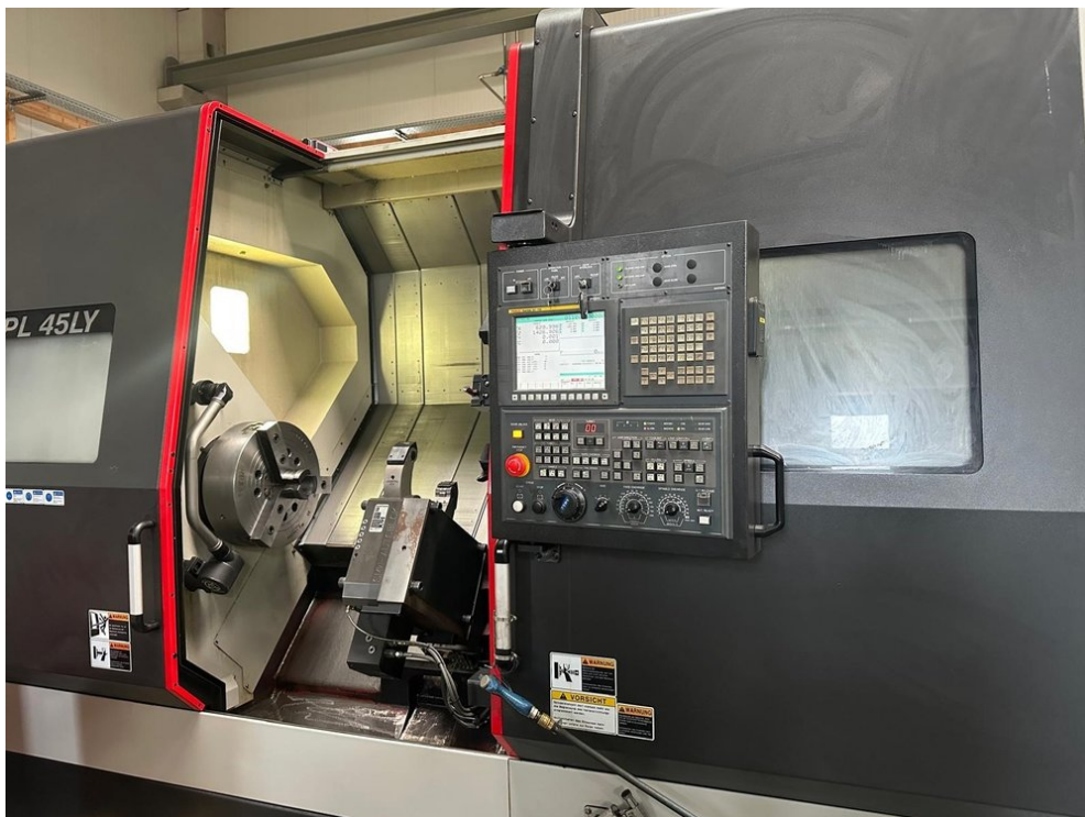
SMEC PL 45LY – Bild 2 von 5