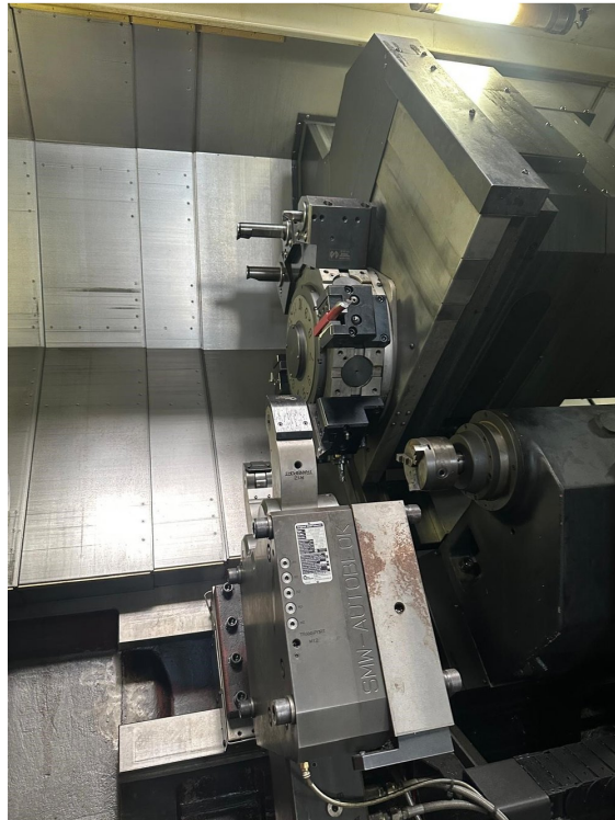
SMEC PL 45LY – Bild 5 von 5