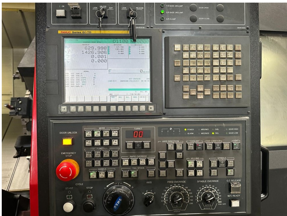
SMEC PL 45LY – Bild 4 von 5