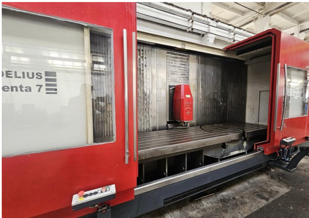
HEDELIUS Tilentä 7 Magnum – Bild 2 von 7