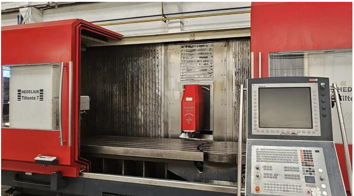
HEDELIUS Tilitenta 7 Magnum – Bild 6 von 7