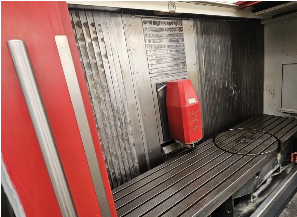
HEDELIUS Tilenta 7 Magnum – Bild 4 von 7