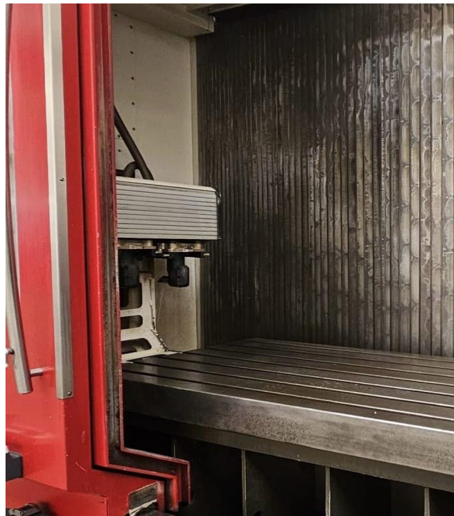
HEDELIUS Tilitenta 7 Magnum – Bild 5 von 7