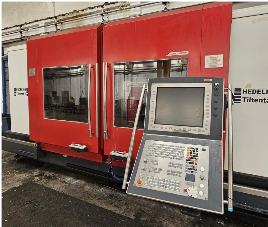
HEDELIUS Tilentä 7 Magnum – Bild 1 von 7