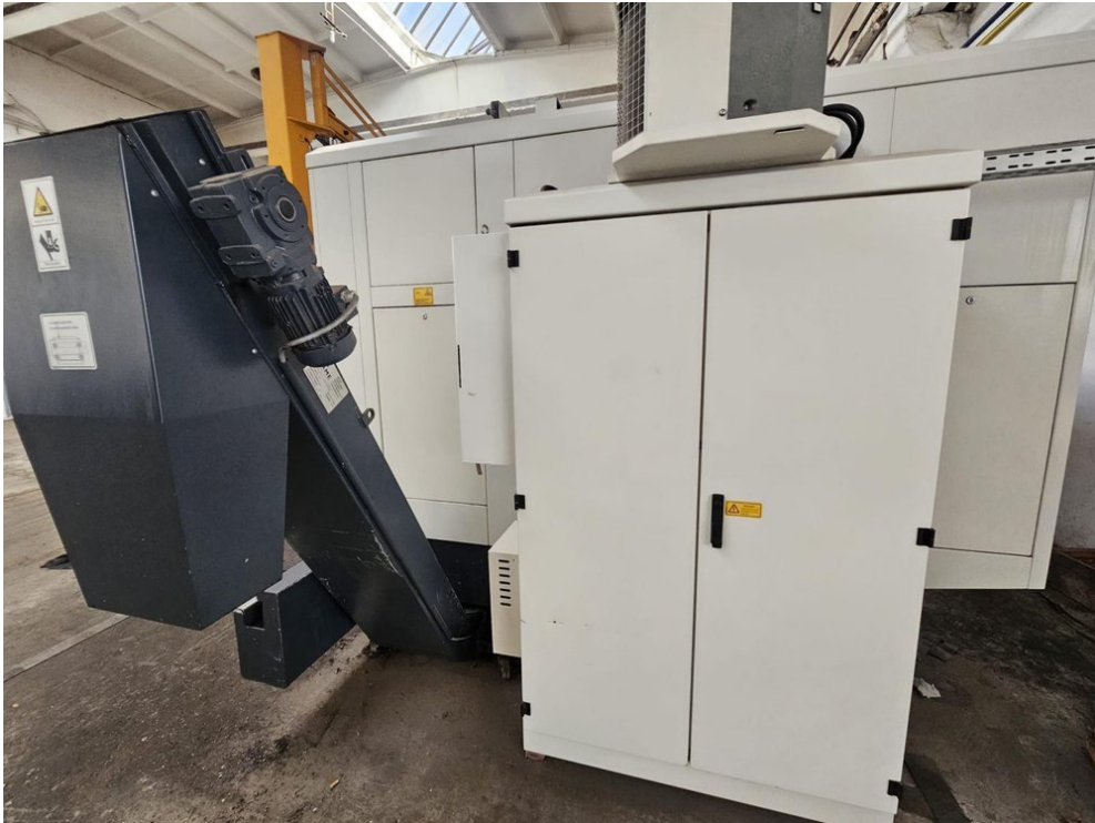
HEDELIUS Tilenta 7 Magnum – Bild 3 von 7