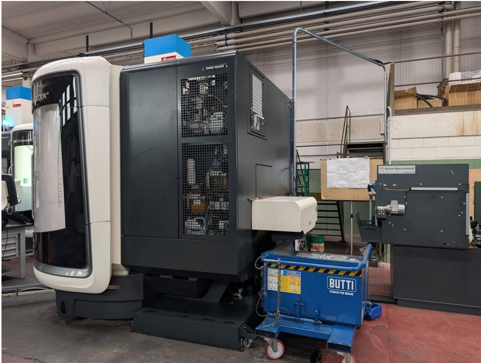
Deckel Maho DMG DMU 70 monoblock – Bild 1 von 7