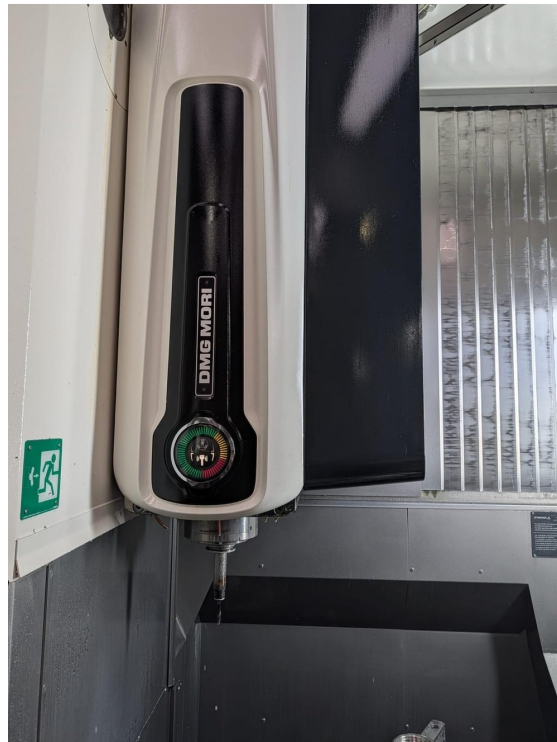
Deckel Maho DMG DMU 70 monoblock – Bild 4 von 7