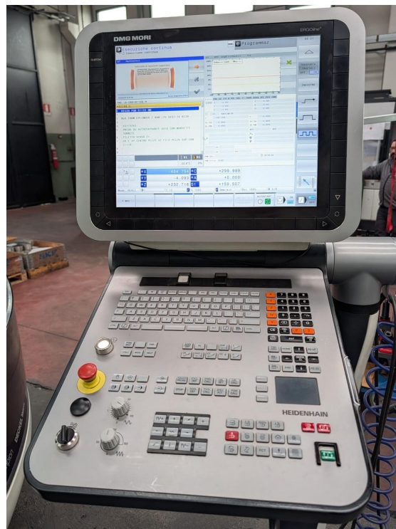
Deckel Maho DMG DMU 70 monoblock – Bild 2 von 7