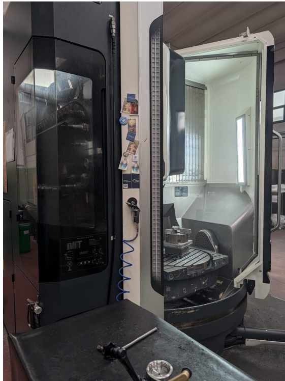
Deckel Maho DMG DMU 70 monoblock – Bild 7 von 7