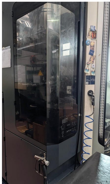
Deckel Maho DMG DMU 70 monoblock – Bild 6 von 7