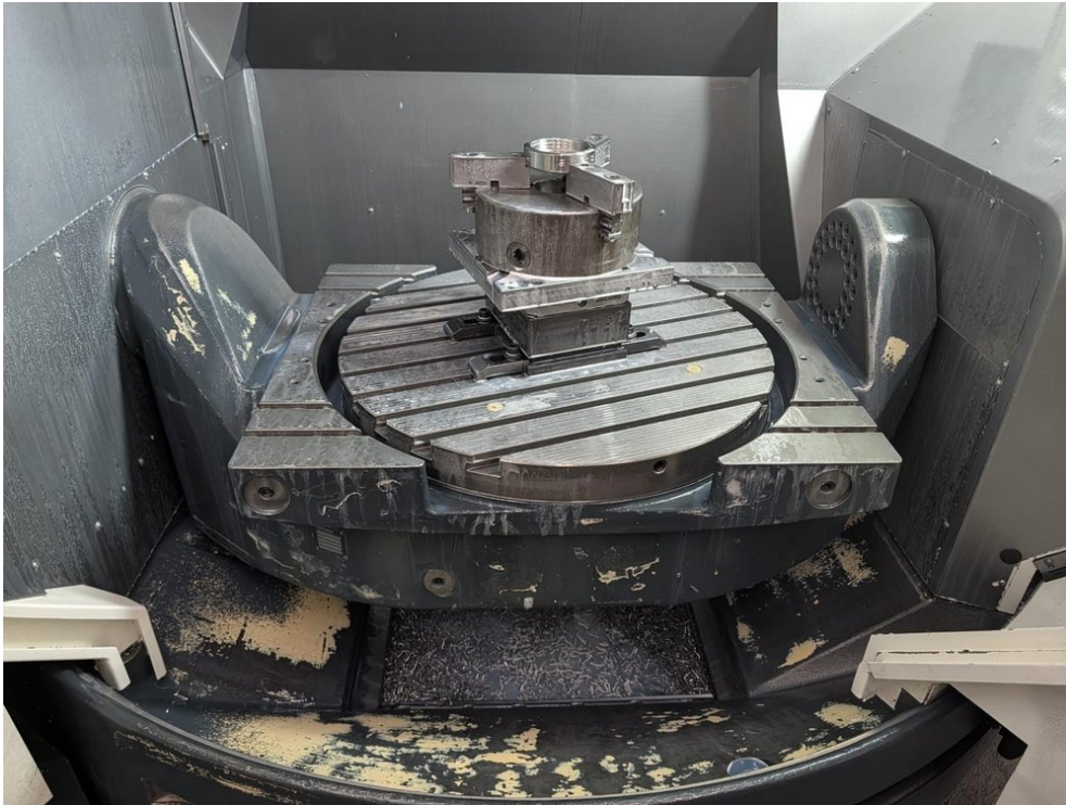
Deckel Maho DMG DMU 70 monoblock – Bild 3 von 7